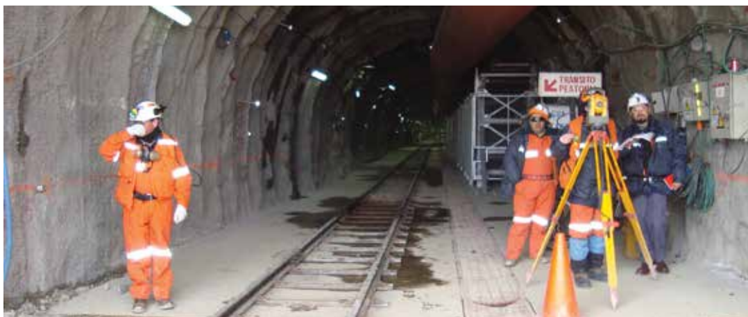
Figura 9: Túnel de 9 kilómetros entre Los Bronces y el yacimiento Los Sulfatos construido ilegalmente por AngloAmerican