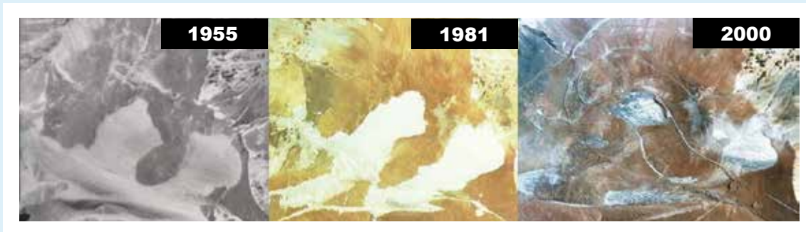
Figura 4: Destrucción de Glaciares Toro 1 y Toro 2, por Barrick Gold, en Atacama

El caso más conocido de destrucción de glaciares en Chile es Pascua Lama, proyecto de explotación minera de oro de la empresa canadiense Barrick Gold, ubicado en el límite chileno argentino de la Cordillera de Los Andes (provincia de San Juan por el lado argentino y la región de Atacama, por el lado chileno). Las exploraciones para el proyecto Pascua Lama entre los años 1981 y 2000 destruyeron en forma irreversible el 62% del Glaciar Toro 1 y el 71 % el Glaciar Toro 2 (Golder Associates, 2003).