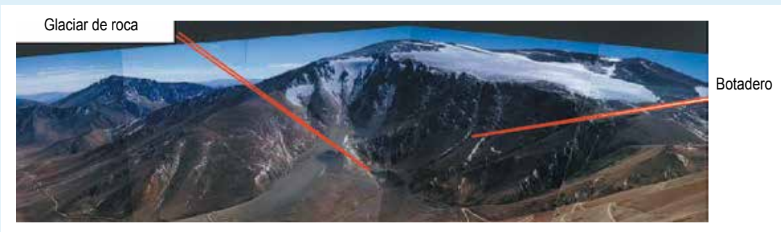
Figura 5: Intervención Futura del Glaciar de Roca: Botadero Nevada Norte

La empresa Barrick Gold también ha intervenido el glaciar Esperanza en la misma cuenca, en la comuna de Alto del Carmen, mediante la construcción de caminos, transporte de vehículos y maquinarias y la dispersión de material particulado, lo cual no ha sido sancionado por las autoridades de gobierno. Además de la impunidad por estos daños, la Comisión Regional de Medioambiente de Atacama, aprobó en 2005 un Estudio de Impacto Ambiental, que permite a la empresa extraer oro mediante minería subterránea bajo el área de los glaciares y también depositar el material de descarte de la mina sobre el glaciar de roca más grande existente en la zona (Chile Sustentable, 2010).