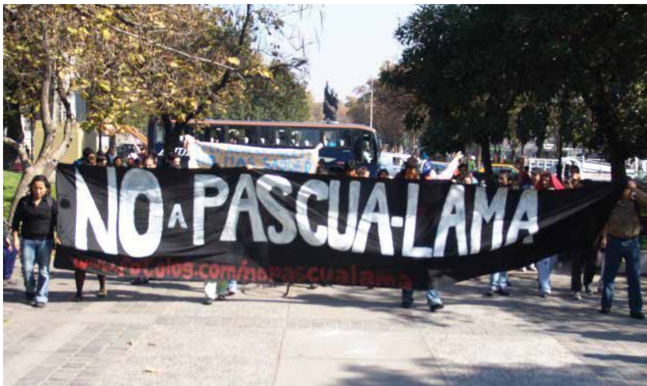
Figura 11: Manifestación en contra de Barrick Gold