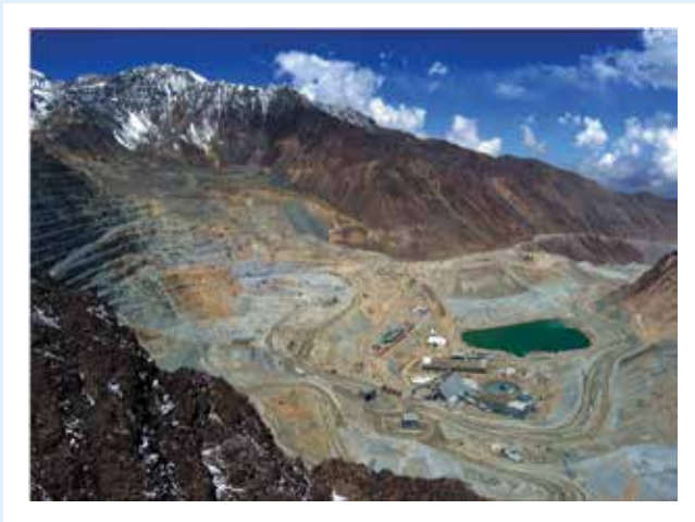
Figura 7: Área de explotación actual Mina Los Bronces