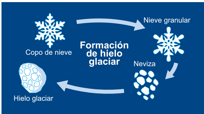
Figura 1: Ciclo de la glaciación