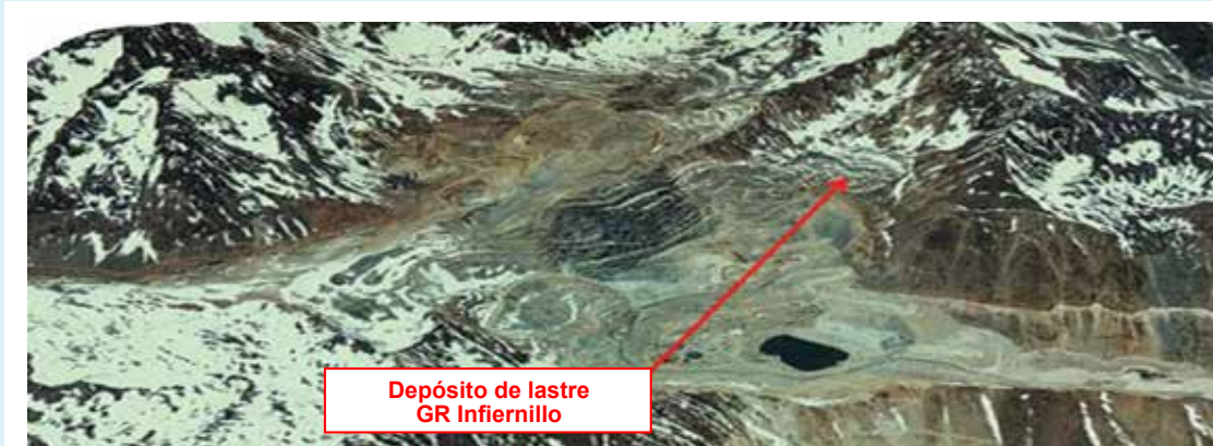
Figura 6: Impacto de CODELCO sobre glaciares en la Mina Sur-Sur, en la cuenca del río Aconcagua

El Estudio de Impacto Ambiental presentado por Codelco a evaluación en 2010 y luego retirado del proceso, informa sobre la afectación de 100 hectáreas de glaciares (Fuente: Oficio N° 111747 Solicitud de Evaluación del EIA “Proyecto expansión Andina 244 ). Dicho impacto sería inaceptable, pues reduciría importantes reservas de agua en la cuenca del río Aconcagua, agravando los actuales conflictos por el agua entre Codelco y los regantes, e intensificaría la vulnerabilidad de la región de Valparaíso frente al cambio climático.