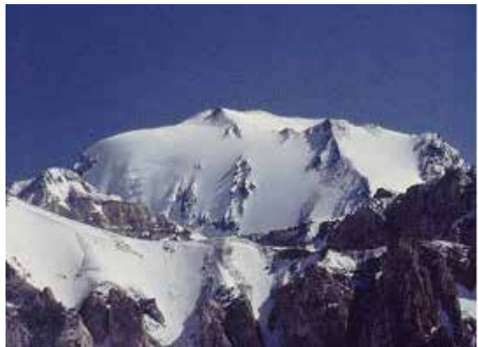
Figura 2: Glaciar descubierto Cerro El Plomo, Santiago, Chile

Sin embargo, la mayor parte de los glaciares chilenos, desde el centro del país hasta Campos de Hielo Sur en la Patagonia son templados; su hielo se mantiene a temperatura de fusión y su derretimiento es importante, dependiendo del grosor y densidad del hielo, y de la pendiente que determina su desplazamiento. No obstante, en el norte de Chile y en las regiones de Coquimbo, Valparaíso y Santiago la característica más marcada de los glaciares es que son poli termales, es decir, son fríos en la parte superior y templados en la parte inferior, por lo cual presentan un importante derretimiento en verano y en periodos de sequía (Larraín 2011, en base a Rivera 2005).