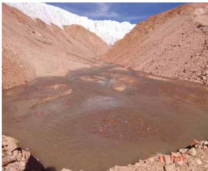
Figura 3: Glaciar Guanaco, Cuenca Río Huasco, Región de Atacama